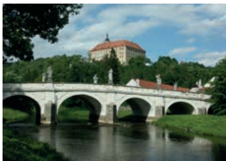
Zámek Náměšť nad Oslavou