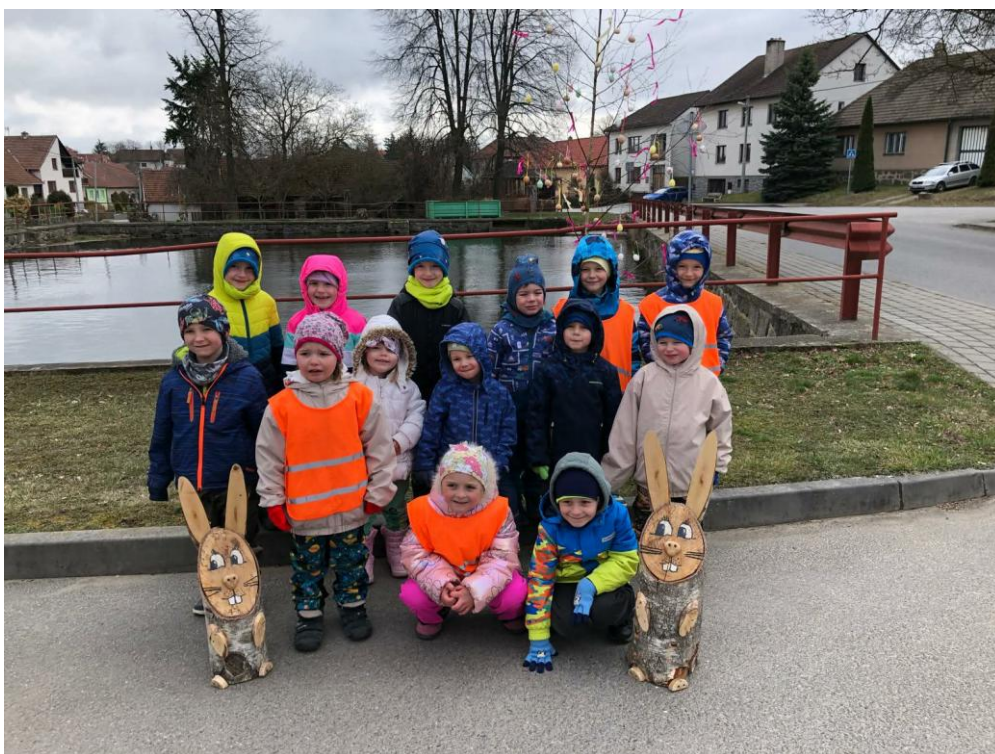
Příprava Velikonoční výzdoby